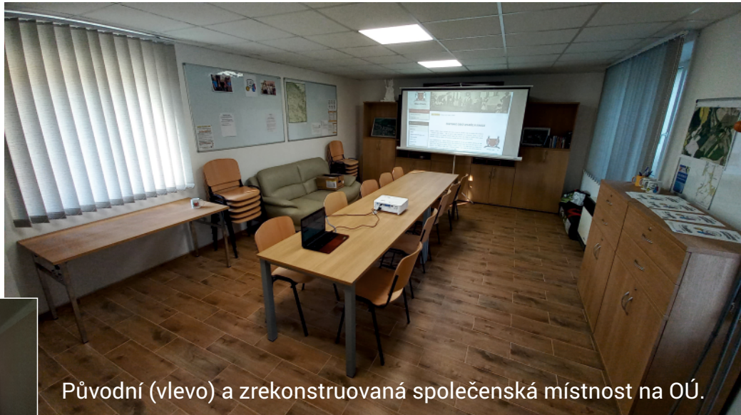
Původní (vlevo) a zrekonstruovaná společenská místnost na OÚ.

Blíží se čas Vánoc. Mezi svátky vydáme vánoční speciál a letošní čtvrté číslo. Do té doby mi dovozte, abych vám všem popřál krásný vánoční čas. Abyste advent mohli prožívat plni síly, pevného zdraví a obklopeni láskou. Ač mnozí sníh nemusíte, přál bych nám všem Vánoce na sněhu. To, že jej