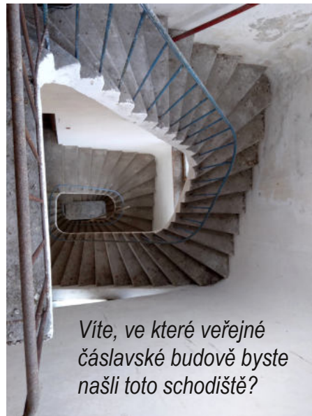
Víte, ve které veřejné čáslavské budově byste našli toto schodiště?

Radka Neumannová, Nora Procházková, Klára Fidlerová