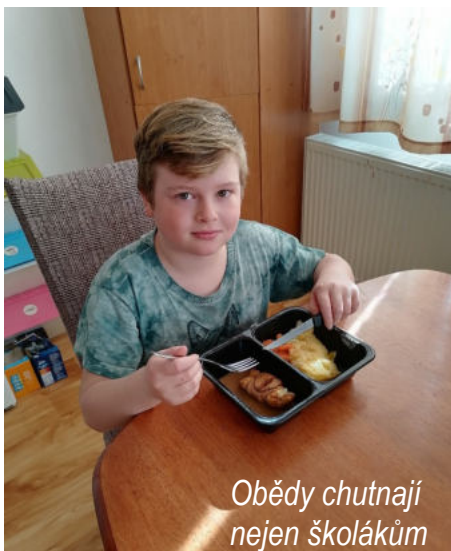
Obědy chutnají nejen školákům

Jak to funguje? V týdenní nabídce Hotelu Grand je každý den jídlo v dětské variantě. Lze si ho vyzvednout na místě, nebo nechat přivést až domů. V tomto případě je nutná objednávka předem